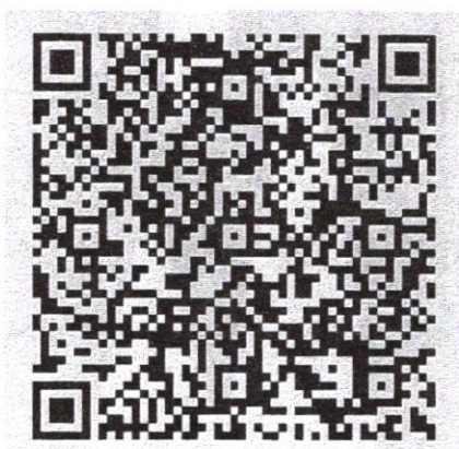
(3 群) 党干校教师系列继续教育专业科目培训班